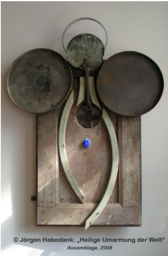
© Jörgen Habedank: „Heilige Umarmung der Welt“ Assemblage, 2008

(„Die heilige Umarmung der Welt“: 1800,- €)