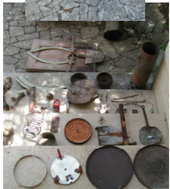
Blick auf das Freilandatelier in Italien und die Materialsammlung