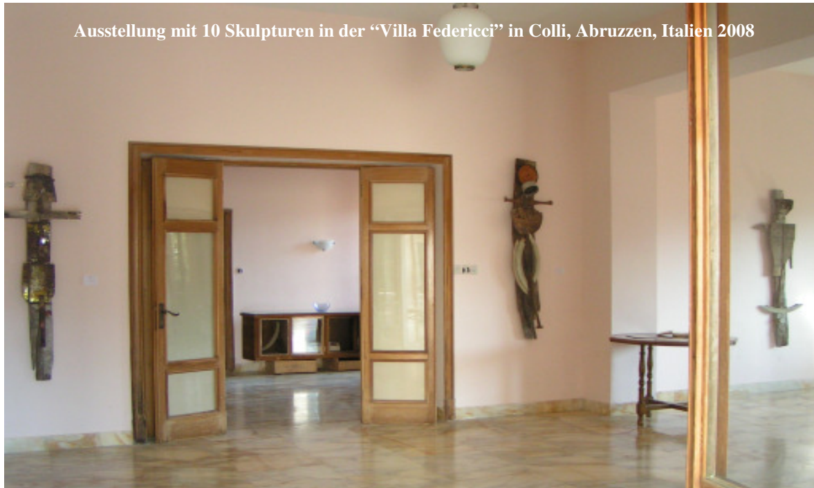
Ausstellung mit 10 Skulpturen in der "Villa Federicci" in Colli, Abruzzen, Italien 2008

Assemblagen – räumliche Collagen – Erzählungen aus Metall und Holz