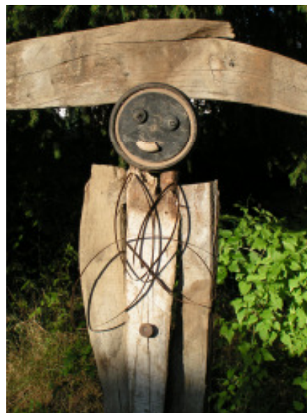
„Der Engel des Herzens“ (hier mit Kind) © Jörgen Habedank Assemblage, 2008 Holz + Metall ca. 220 x 120 x 30 cm 2100,- €