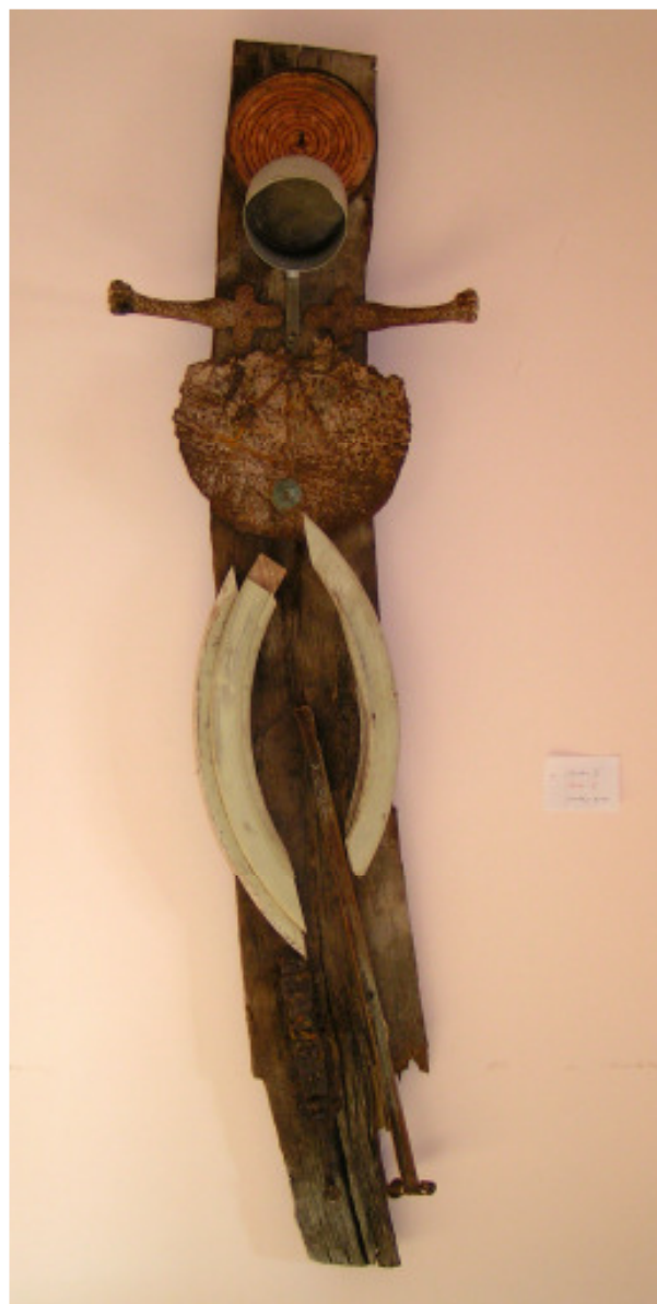
„Christus II“ © Jörgen Habedank Assemblage, 2008 Holz + Metall ca. 180 x 40 x 15 cm 1900,- €