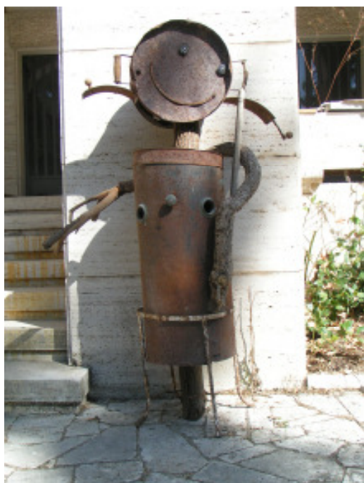
„Lustiges Kind“ © Jörgen Habedank Assemblage, 2008 Holz + Metall ca. 160 x 75 x 60 cm 1500,- €