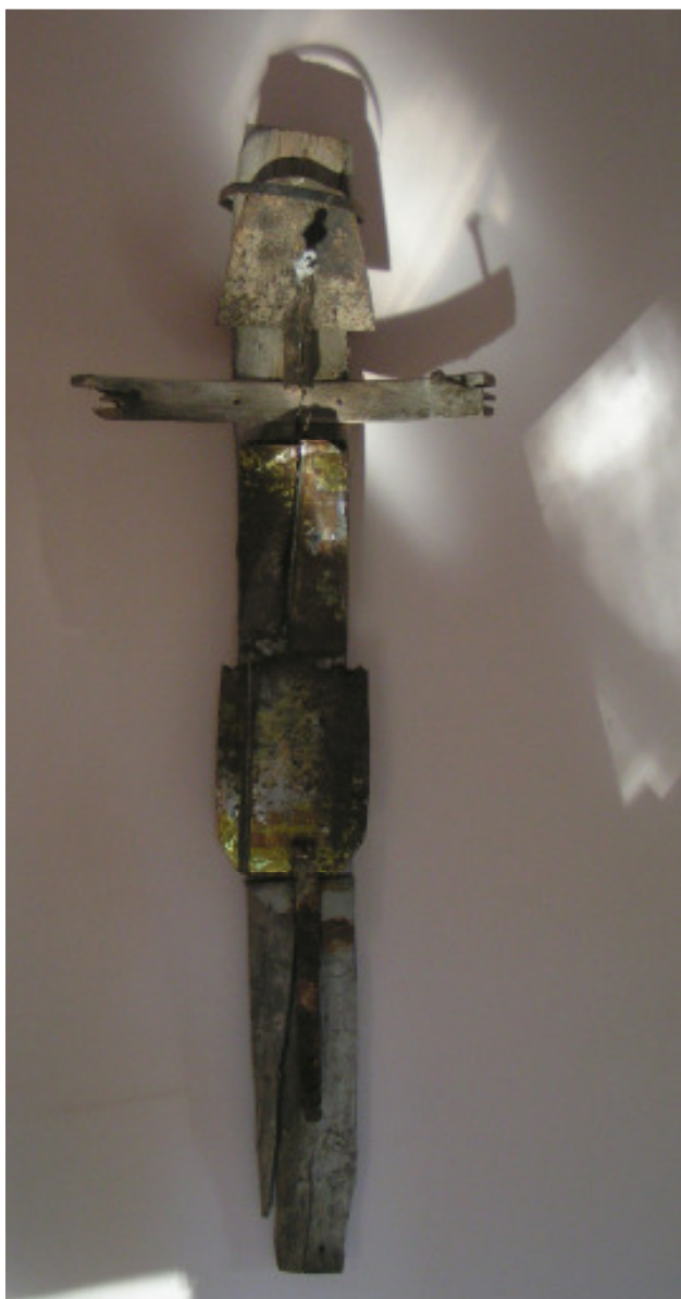
„Christus I“ © Jörgen Habedank Assemblage, 2008 Holz + Metall ca. 170 x 50 x 15 cm unverkäuflich

Der Betrachter erlebt die Figuren wie Begleiter aus der Welt der Materie, die das Lebendige in sich spüren.